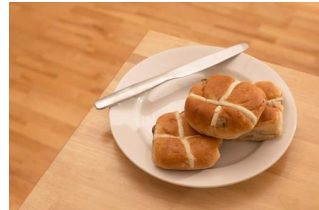
hot cross bun