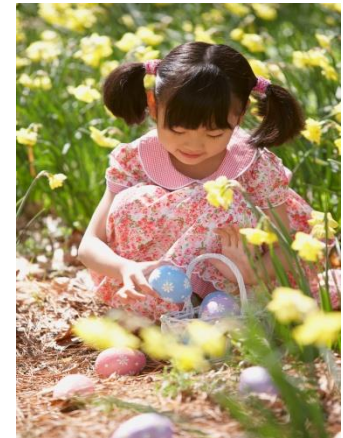
in the garden