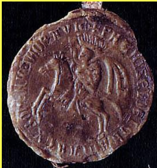
Pečeť Přemysla Otakara I. z roku 1223