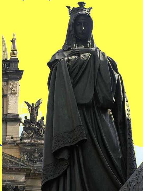
Video: Anežka Česká