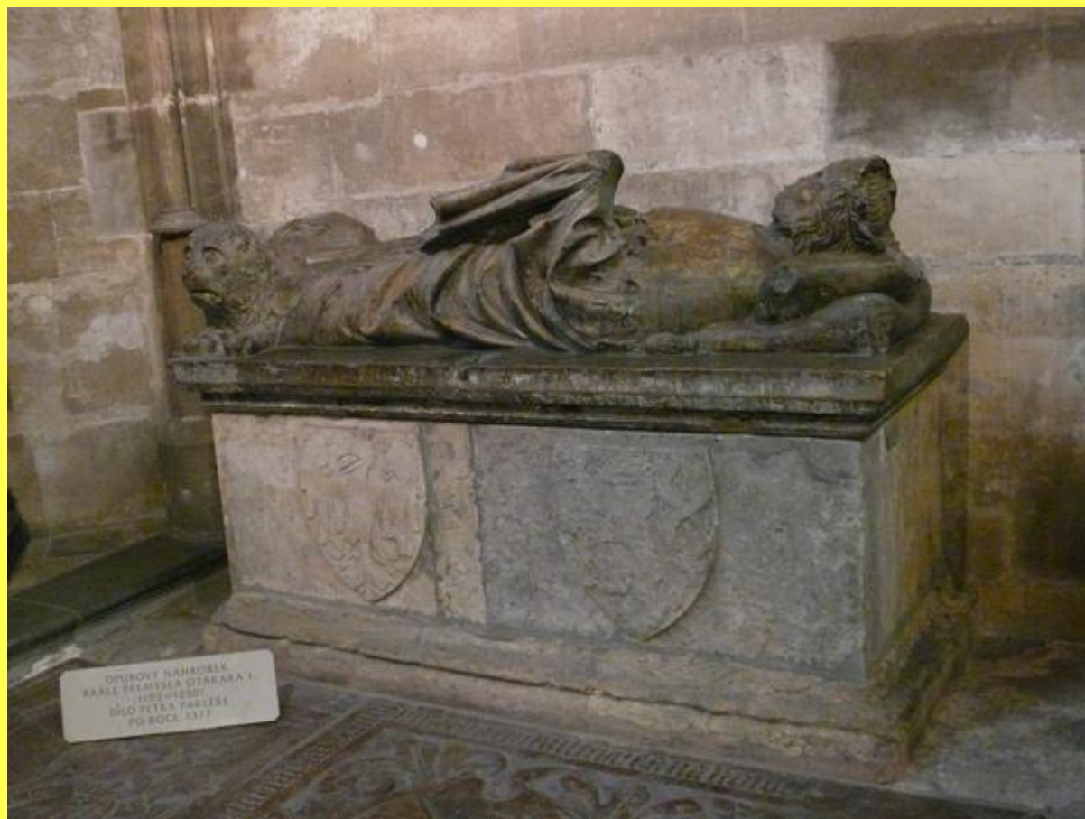
Náhrobek Přemysla Otakara I. od Petra Parlěře