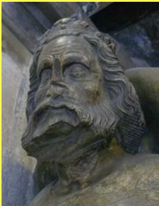
Detail Přemyslova náhrobku od Petra Parlěře