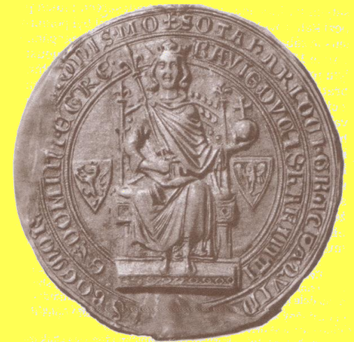
Pečeť Přemysla Otakara II.