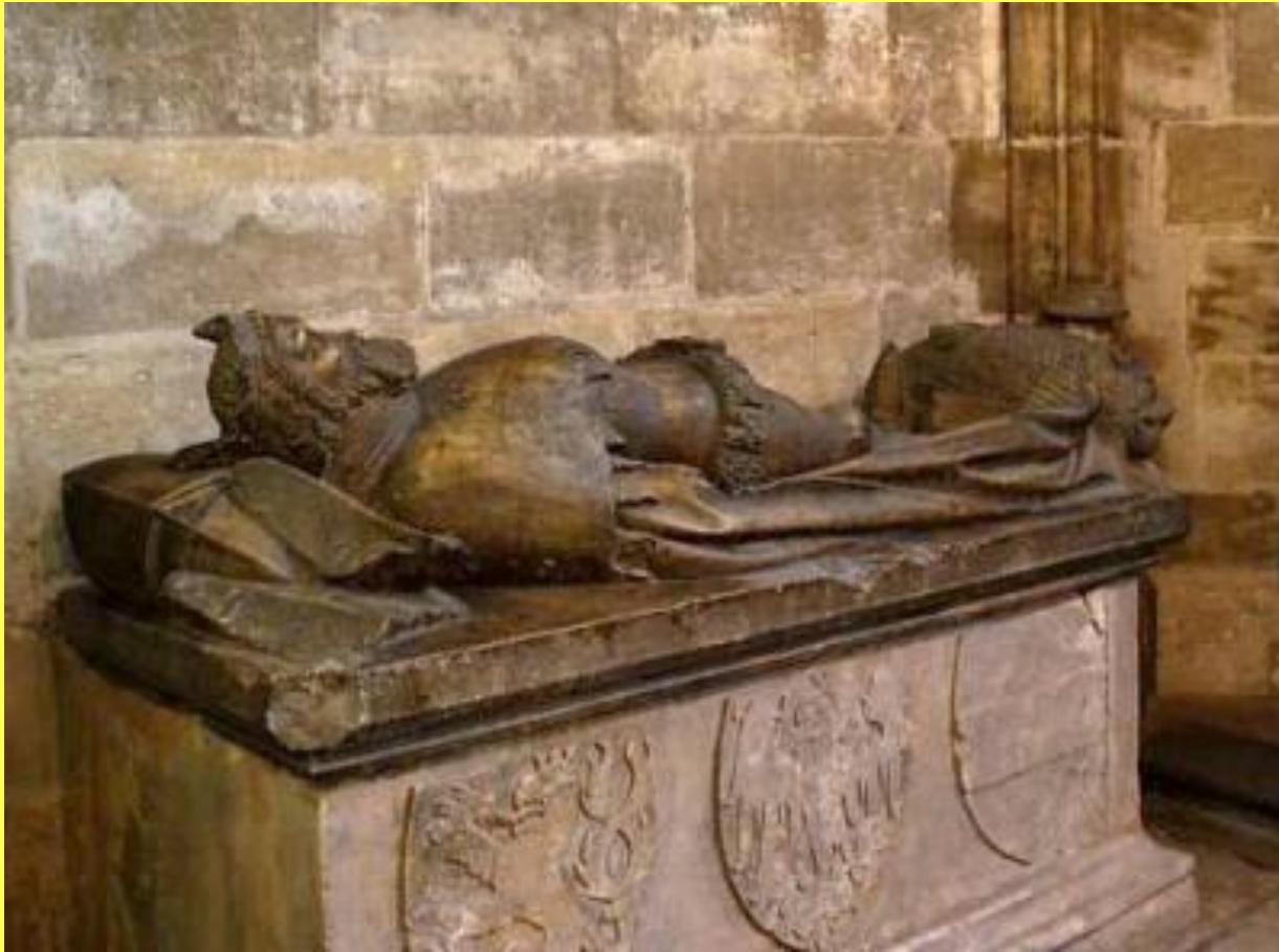
Náhrobek Přemysla Otakara II.