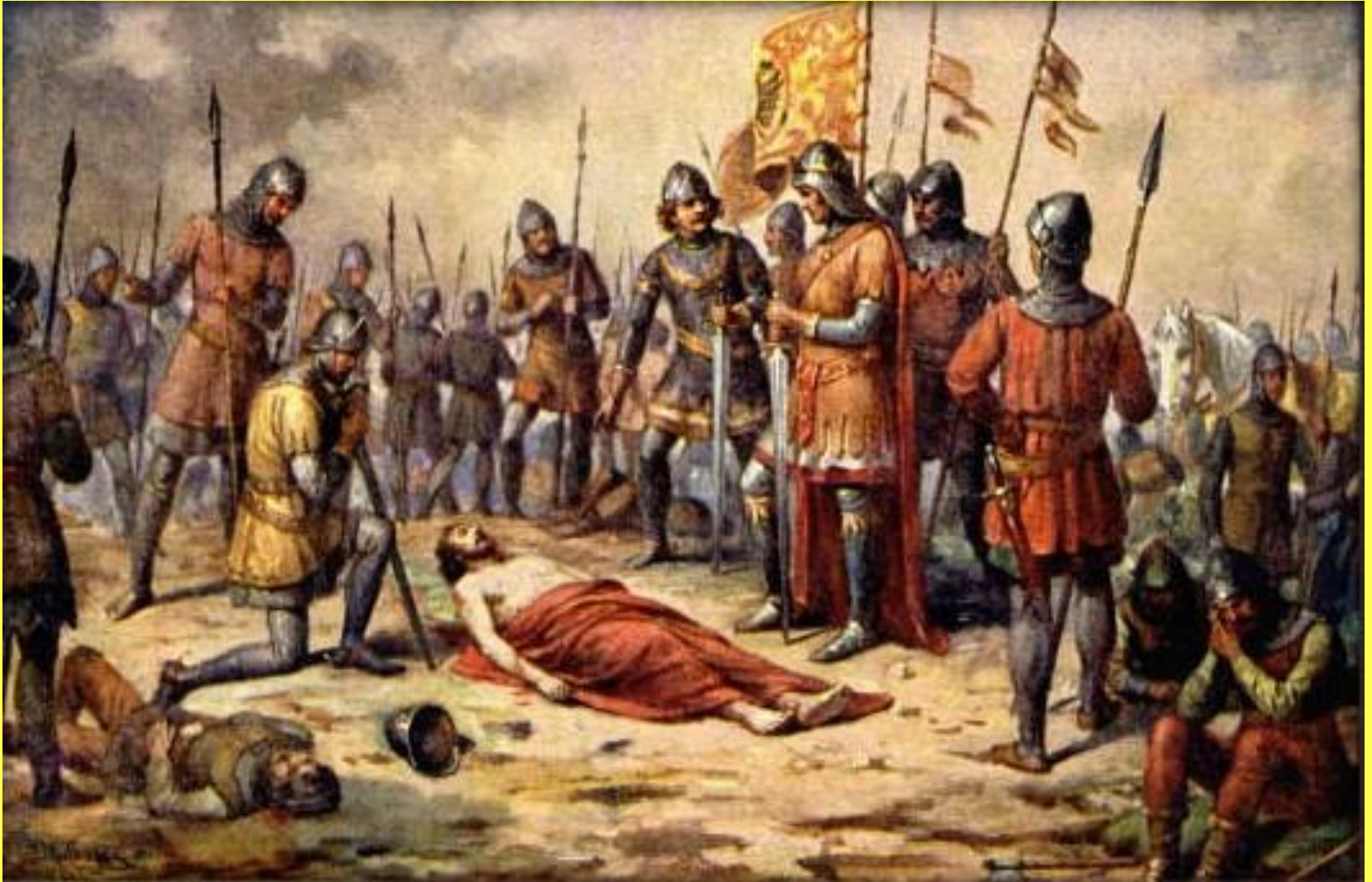
Přemysl Otakar II. po bitvě na Moravském poli