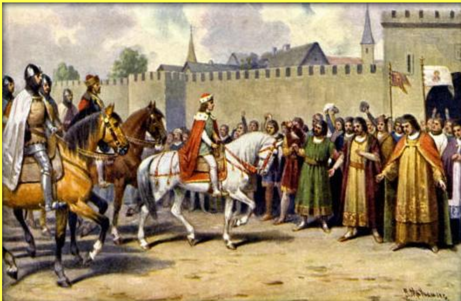
Václav II. přijíždí roku 1282 do Prahy