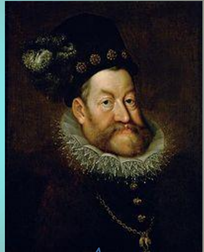
Video Rudolf II.